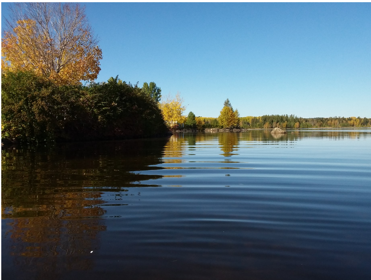
rue des Mélèzes