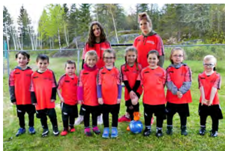
Les Tigres multicolores