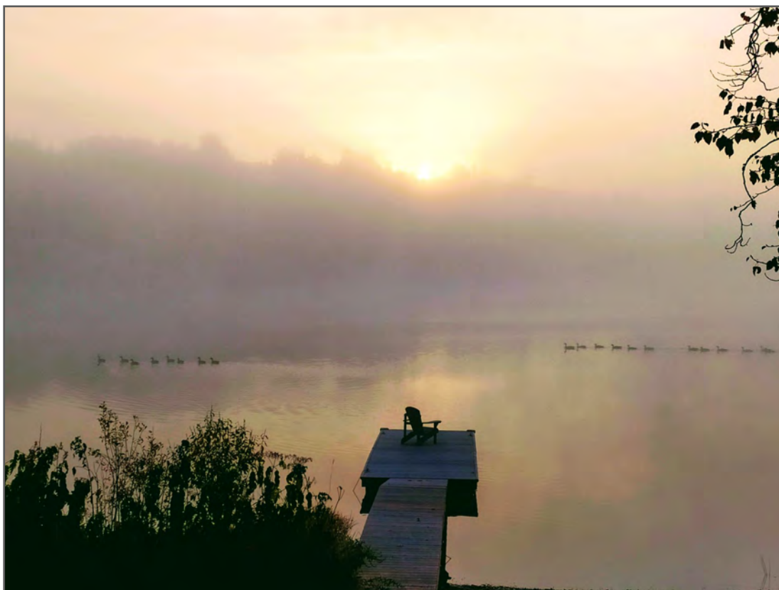
Lac du Camp, 11 octobre 2019