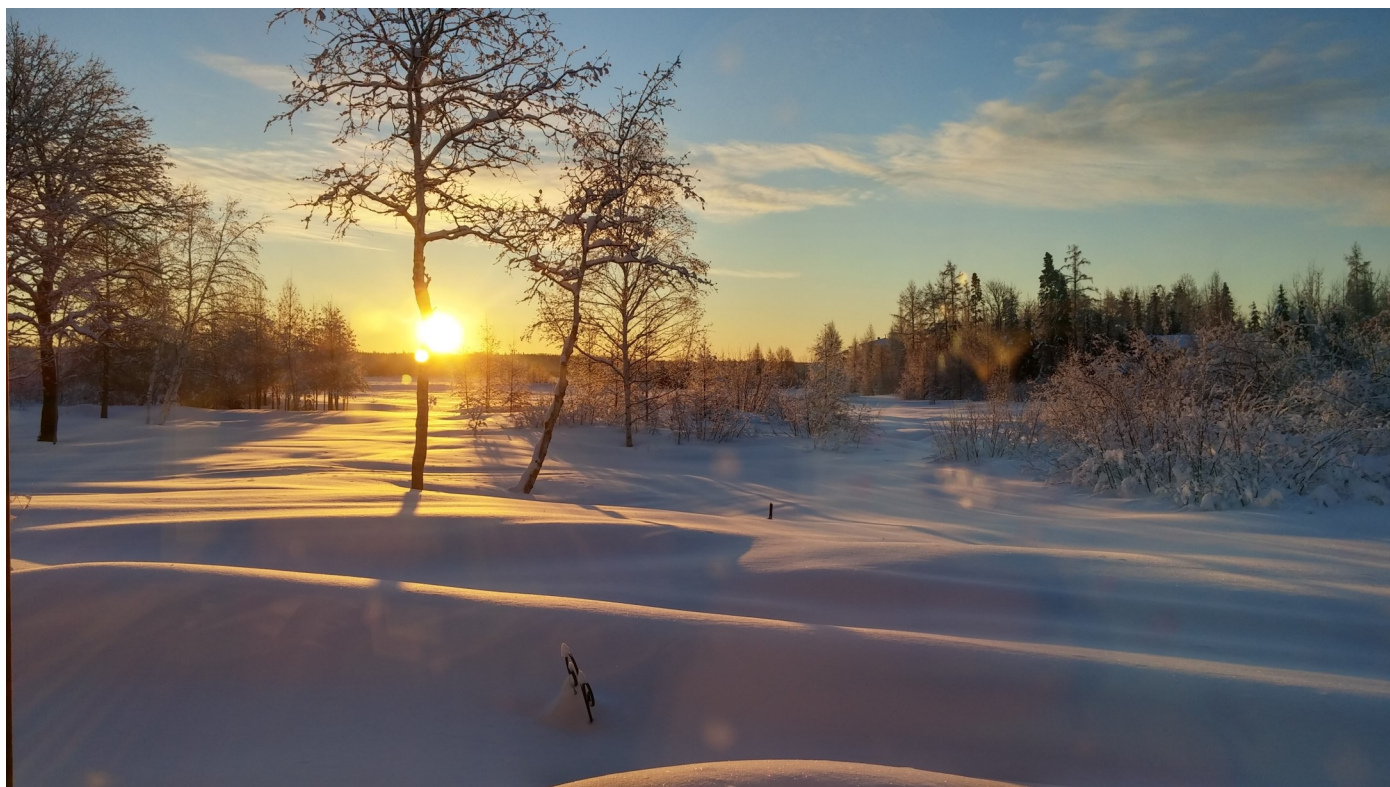
Baie Cascouia, 3 mars 2017