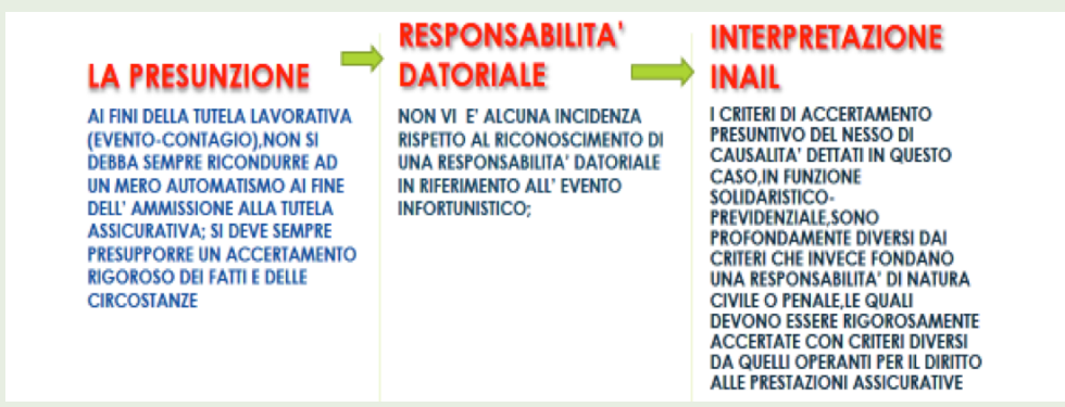
FIGURA 3 - CIRCOLARE INAIL 22/2020

Nella figura 3 abbiamo voluto inquadrare partendo dalle linee guida attuative quelle che attualmente per noi rappresentano dei dubbi interpretativi.