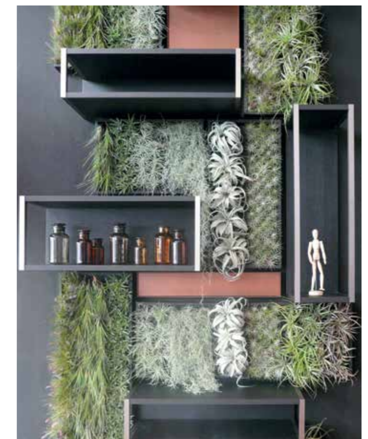
La vetrina dell'elegante flagship store sulla centralissima via Turati.

Sopra, lo spazio espositivo al piano interrato, caratterizzato dal mix tra materiali lucidi e opachi. Sotto, a livello strada il progetto espositivo si completa con un gioco a parete: un insieme di vuoti e pieni intercalati da piante di tillandsia. A sinistra le piante del piano terra, dell'interrato e del soppalco.