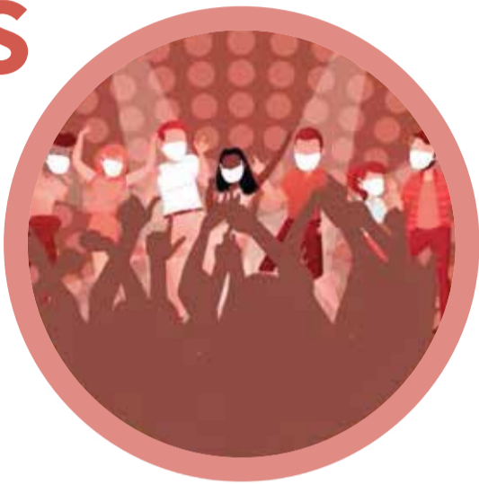
Spații slab ventilate