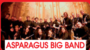
ASPARAGUS BIG BAND