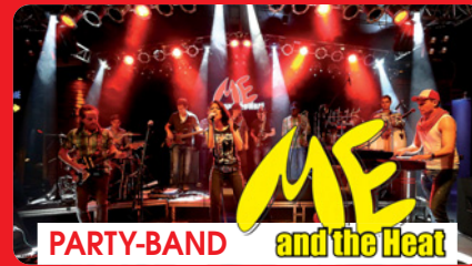
PARTY-BAND and the Heat