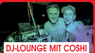
DJ-LOUNGE MIT COSHI