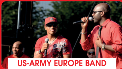
US-ARMY EUROPE BAND