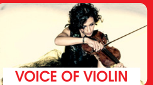
VOICE OF VIOLIN