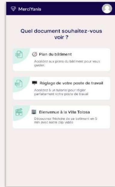
Consulter un document