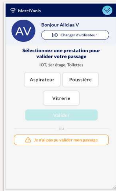
Valider un passage (uniquement l'agent)