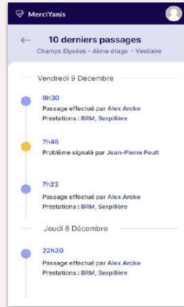
Visualiser derniers passages