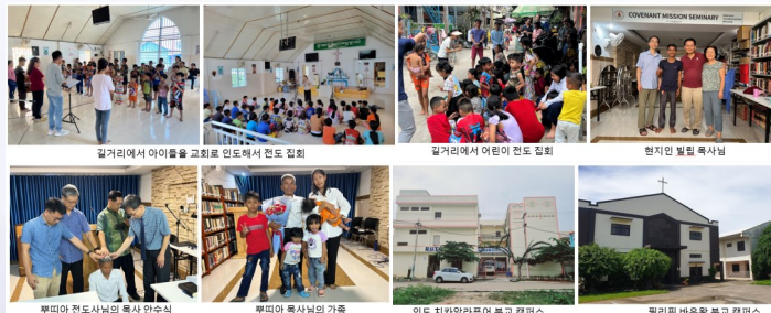
필리핀에서 아이들을 교회로 인도해서 전도 집회 | 필리핀에서 어린이 전도 집회 | 형제인 빌립 목사님 | 뿌띠아 전도사 목사의 목사 안수식 | 뿌띠아 목사의 가족 | 인도 치카발라푸어 본교 캠퍼스 | 필리핀 바왕 본교 캠퍼스