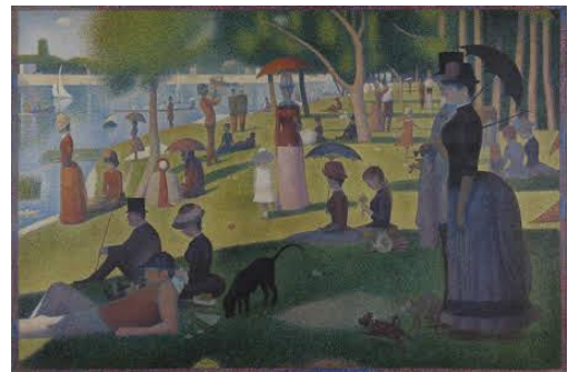
A Sunday Afternoon on the Island of La Grande Jatte