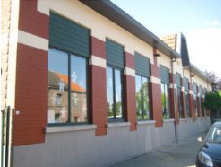
Kleuterschool Kabouterland Grevensmolenweg 16