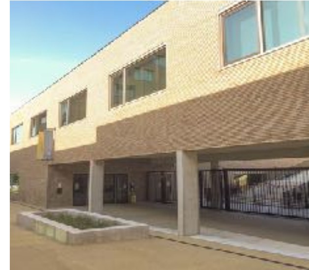
Lagere school GAZO Gazometerstraat 5