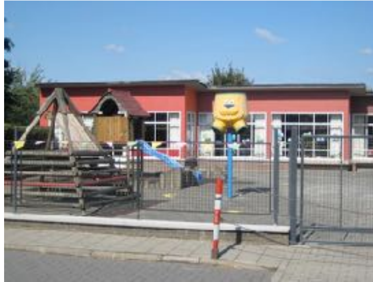
Kleuterschool De Brug Halmaalweg 121