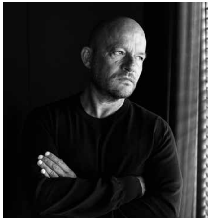
Portrait Vincent Van Duysen

vincentvandyusen.com | maartendeceulaer.com