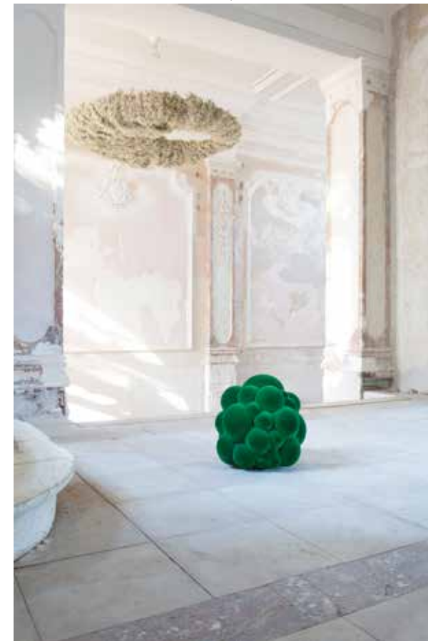
Mutation Stool, 2012

He studied at the Sint-Lucas School of Architecture in Ghent. Asked how Belgian design has evolved, Van Duysen answers: 'Design is increasingly becoming what it should be... Belgium's performing arts, fashion and architecture are very creative. So, our weight is sited more in collective individuality than in aesthetic.' Vincent Van Duysen is both an architect and a designer. Firstly though, he sees himself as an 'architect'. If it's about interior design, furniture or objects, increasingly he begins from an architectural perspective. Van Duysen is brief on his 'favourite project'. As each project has its beauty, dependent on its location, client and 'challenging limitations'.