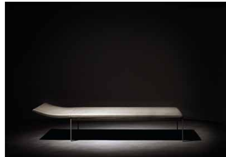
VVD Collection for B&B Italia, 2002