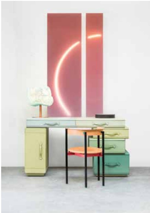
Maarten De Ceulaer | Writing Desk of Suitcases - 2013

O ver dubbelportret-tegenpool Vincent Van Duysen is Maarten De Ceulaer heel lovend. Hij apprecieert het contemplatief zen-gehalte in diens werk en zou graag met hem een project, compleet met interieur, realiseren.