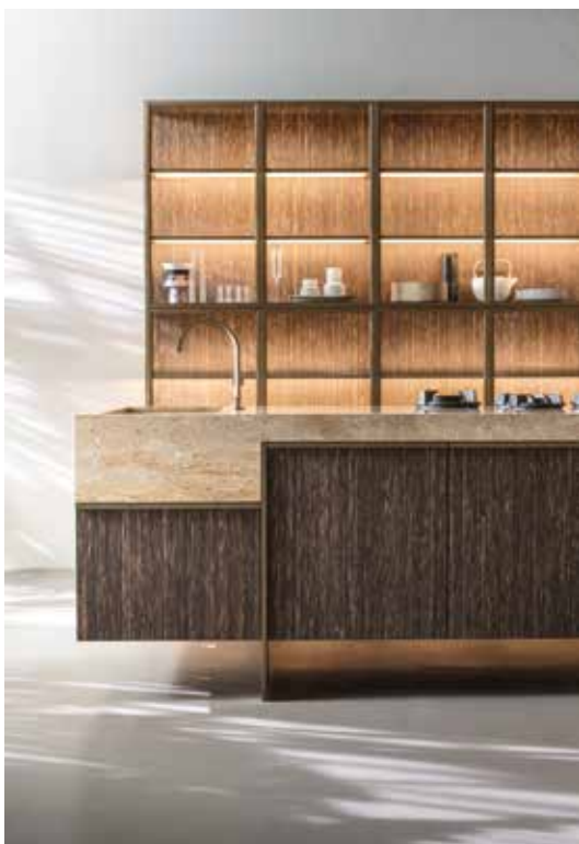
Vincent Van Duysen | Ratio for Dada - 2019