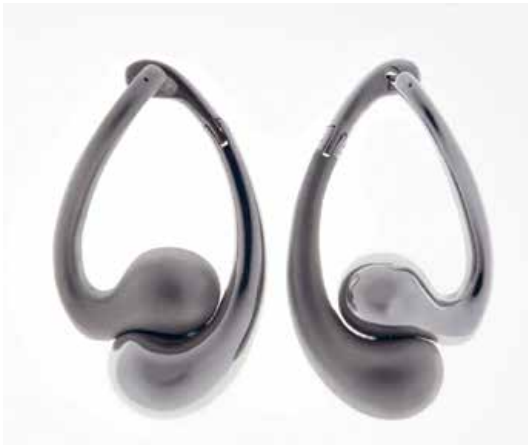
21 — Lee Ufan , boucles d'oreilles, argent poli et brossé / sterling silver earrings, ed. 8 + 4 EA/AP, 2012-2013. Courtesy Galerie Minimasterpiece, Prix sur demande / Price on request www.galerieminimasterpiece.com