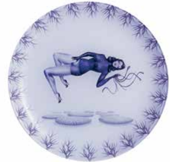
2 — Mirka Lugosi , assiettes / plates édition limitée, coffret de 4 / limited edition, box of 4, ed. Luminarc & Palais de Tokyo, 2012, €39,00 - €44,00 www.luminarc.com www.palaisdetokyo.com