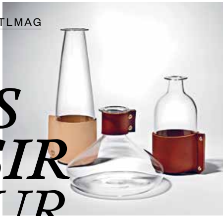
1 — Simon Hasan , Wrap , verrerie / glassware, 2012, €200,00 - €320,00 www.simonhasan.com