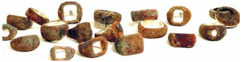
20 — Jorge Manilla Navarrete , Tales of a Big City , bagues / rings, exposition Design Vlaanderen exhibition 'Tales of Heroes', Prix sur demande / Price on request www.jorgemanilla.com , www.designvlaanderen.be