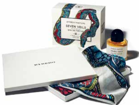
5 — Seven Veils , eau de parfum et écharpe en soie, inspirés de la légende biblique de la danse de Salomé, édition limitée / perfume and silk scarf, inspired by the biblical tale of Salome's dance, limited edition, Byredo, 2012, €290,00 www.byredo.com