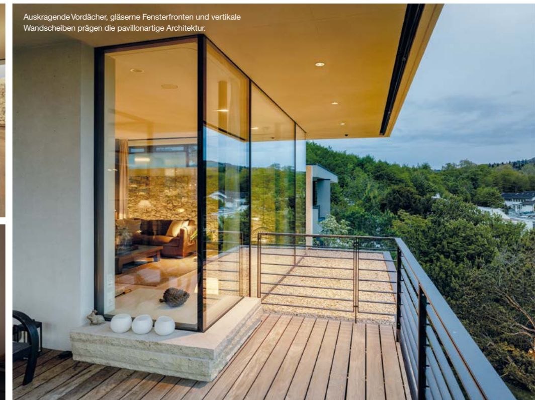
Ausragende Vordächer, gläserne Fensterfronten und vertikale Wandscheiben prägen die pavillonartige Architektur.