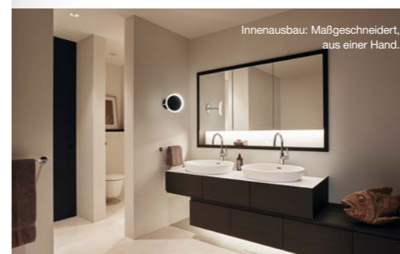
Innenausbau: Maßgeschneidert, aus einer Hand.