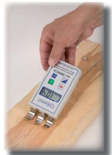
Mittaussyvyys 100 mm, - puupalkin kosteusvaurioiden paikallistaminen