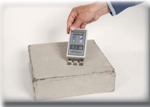
Mittaussyvyys 100 mm -mittaa betonilaatan kosteutta