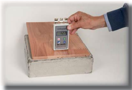
Mittaussyvyys 10 mm - mittaa puulattian kosteutta