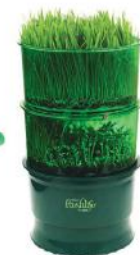
Проращиватель Tribest FL-3000