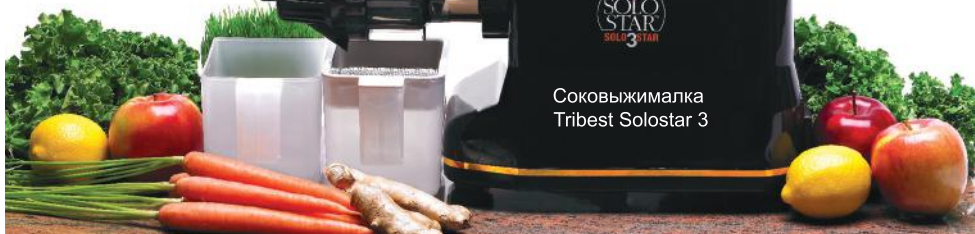
Соковыжималка Tribest Solostar 3