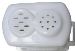
Насадка с формами для пасты