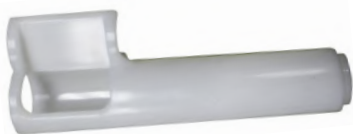
Трубка для пасты

Внимание! Убедитесь, чтобы тесто было не слишком влажное.