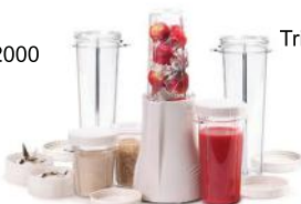
Мини блендер Tribest PB-250