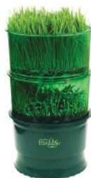
Проращиватель Tribest FL-3000