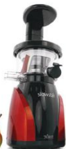
Соковыжималка Tribest Slowstar SW-2000