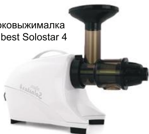
Соковыжималка Tribest Solostar 4