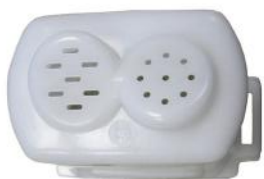
Насадка с формами для пасты

Внимание! Убедитесь, чтобы тесто было не слишком влажное.