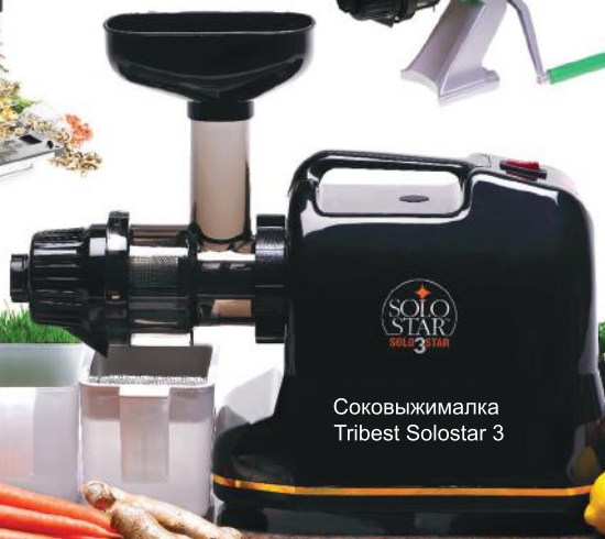
Соковыжималка Tribest Solostar 3