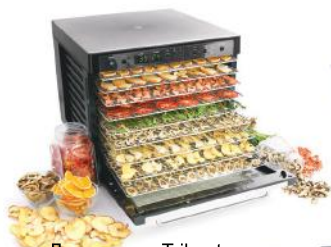
Дегидратор Tribest Sedona SD-P9150