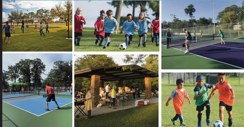
Recreation Elements Final Master Plan