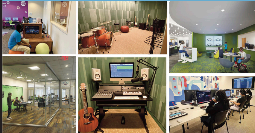
Building Expansion Amenities Final Master Plan