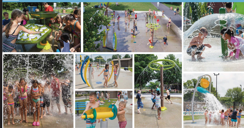
Splash Pad Elements Final Master Plan