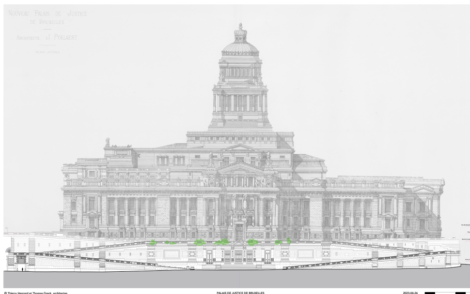
Étude préalable des rampes - 2023