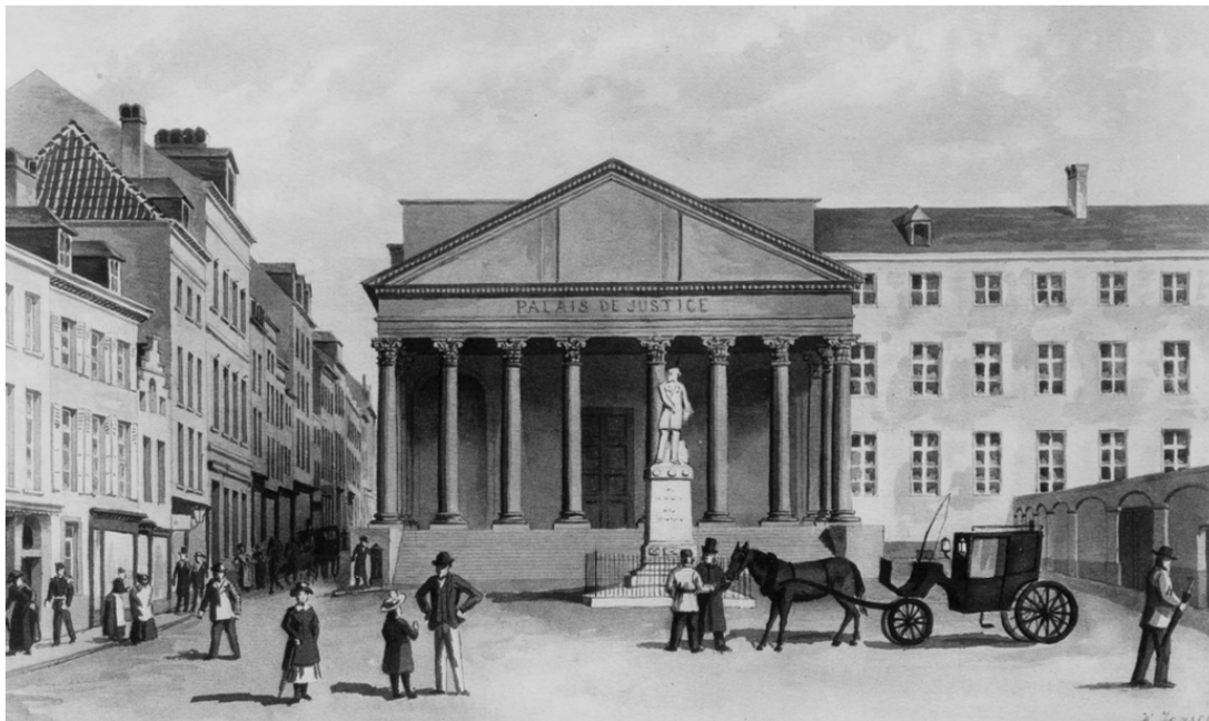
Le premier Palais de Justice. Dessin de Harald Jensen, 3 e quart du XIX e siècle. © IRPA, Bruxelles, cliché B060415.

La rue de Ruysbroeck se trouve sur la gauche.