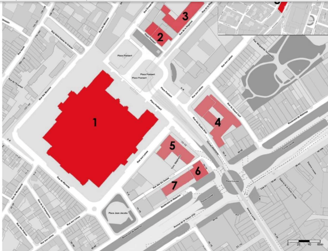
Plan du Campus Poelaert © Thierry Henrard et Thomas Greck, architectes, janvier 2021.